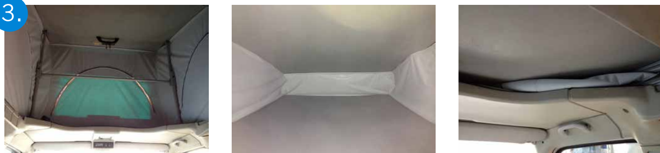
3. Il est possible de fermer le toit tout en gardant l'isolant installé.