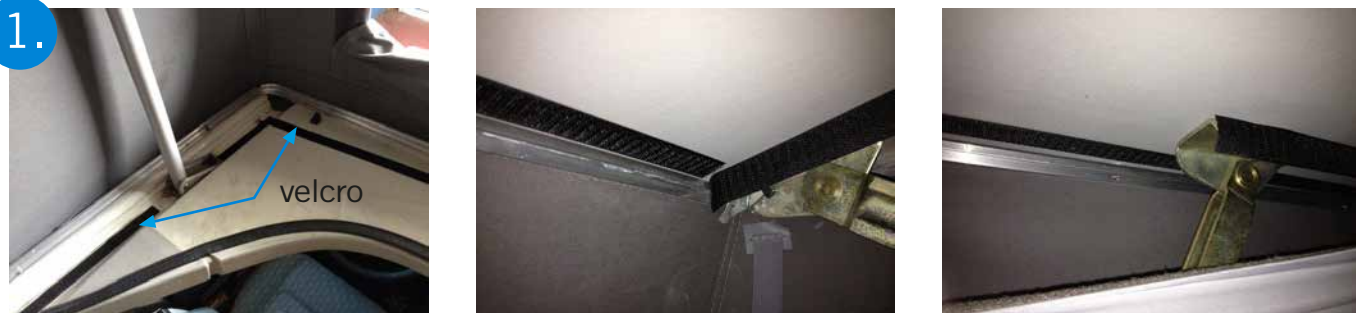
1. Coller les bandes de Velcro.